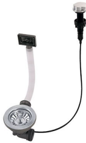
自动下水 8407 000